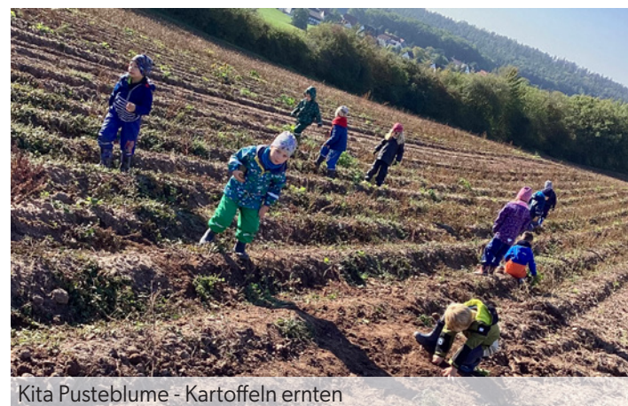
Kita Pustebume - Kartoffeln ernten