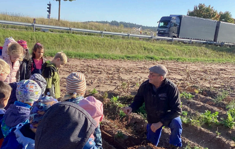
Kita Pustebume - Kartoffelernte