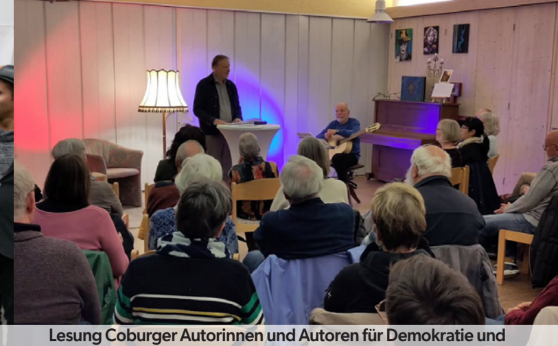
Lesung Coburger Autorinnen und Autoren für Demokratie und

Wie schön, dass ihr dabei wart und mit uns gefeiert habt