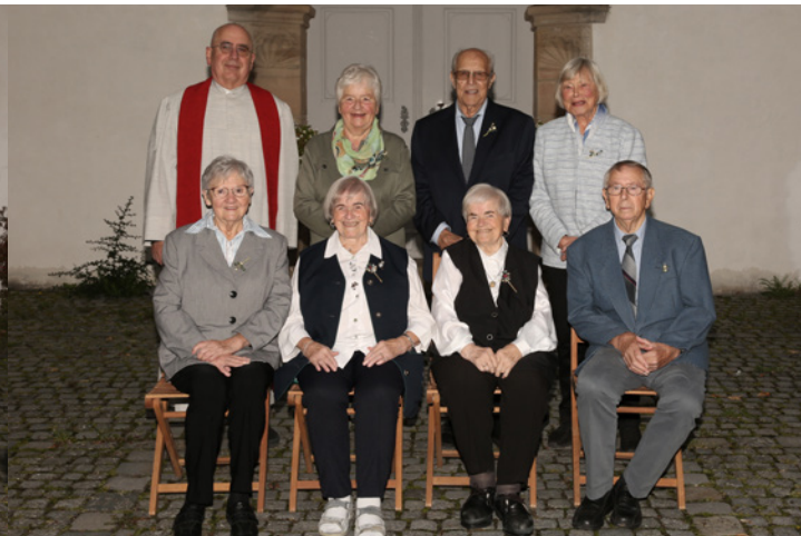
Kronjuwelene und Gnadene Konfirmation

Gottesdienste am See - Wieder liegen zwei sehr schöne Gottesdienste am See hinter uns. Ob bei Sonnenschein oder Regenwetter, es ist immer wieder toll, dass wir gemeinsam am Wolfgangsee zusammenkommen zu Gottesdienst und Kirchencafé.