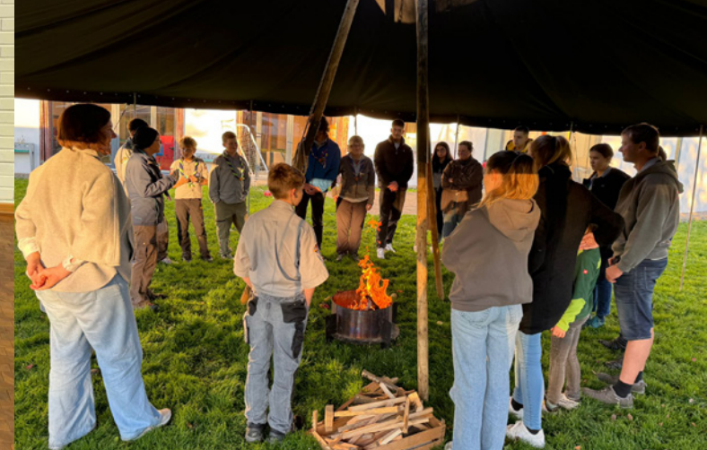
Stammesversammlung des Pfadfinderstammes Albatros