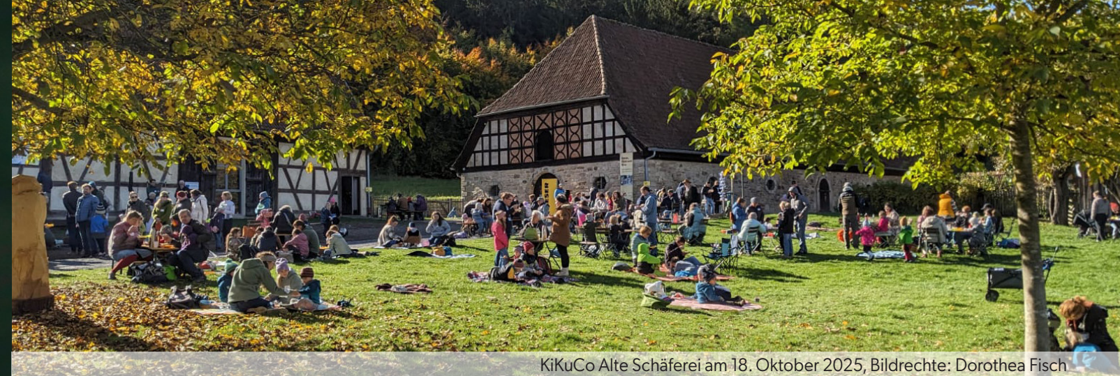
KiKuCo Alte Schäferei am 18. Oktober 2025