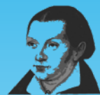
Katharina von Bora