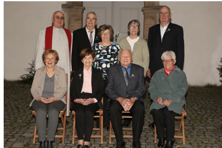
Eiserne und Diamantene Konfirmation

Weltoffenheit - Schön, dass ihr so zahlreich mit dabei wart!