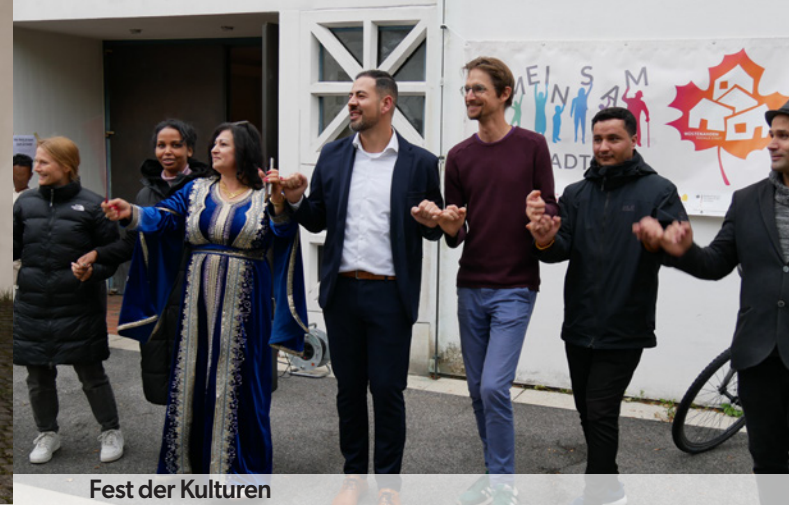
Fest der Kulturen

Wie schön, dass ihr dabei wart und mit uns gefeiert habt