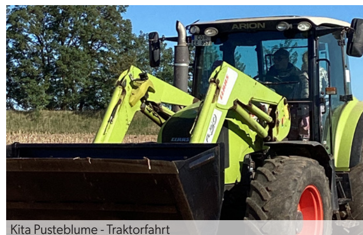
Kita Pustebume - Traktorfahrt